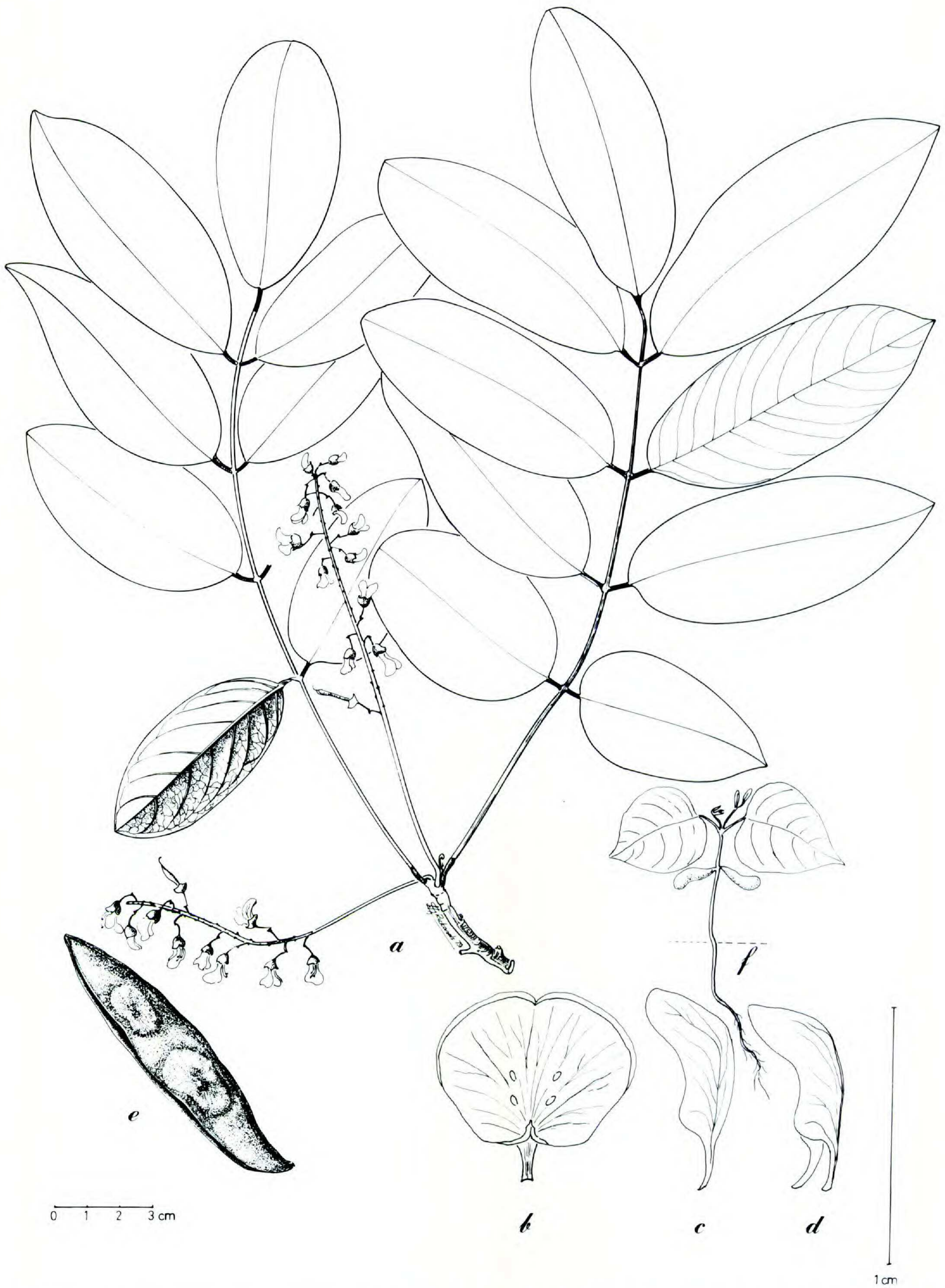
FIGURE 4. Lonchocarpus verrucosus .—a. Rama con inflorescencia.—b. Estandartes.—c. Ala.—d. Quilla.—e. Fruto, mostrando el margen vexilar ligeramente alado.—f. Plántula. Las hojas y flores fueron tomadas de Miranda 7179, el fruto de Chavelas 3019 y la plántula de Sousa 10402.